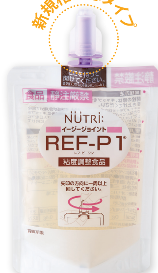
REF-P1 イージージョイント