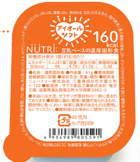
アイオールソフト160 (カップタイプ) 1個 81g

カップタイプ 120kcal エネルギー → 160kcal 4.9g たんぱく質 → 8g